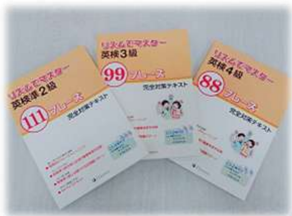
英検対策教材「リズムでマスター」