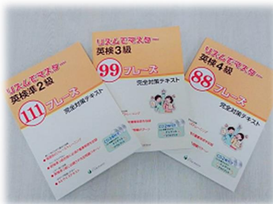
英検対策教材「リズムでマスター」