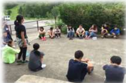
★中1・2 English Camp